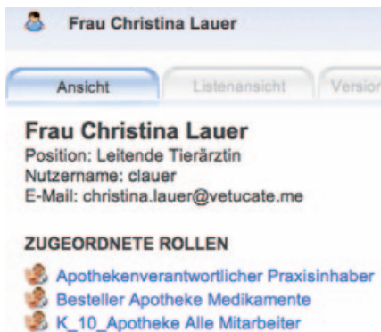
Abb. 2: In der Mitarbeiterübersicht können alle Rollen eingesehen werden, die einem Mitarbeiter zugeordnet wurden. Damit kann jeder sehen, welche Aufgaben im QM-Prozess zu erfüllen sind. Beim Ausscheiden eines Mitarbeiters können dessen Rollen problemlos neu besetzt werden.

Soweit zur Theorie. Aber wie läuft nun die Einführung eines QM-Systems wie GVP ab? Ziel der Einführung eines QM-Systems ist das Verfassen eines sog. Handbuchs (Kasten). In diesem Handbuch werden alle Zuständigkei-